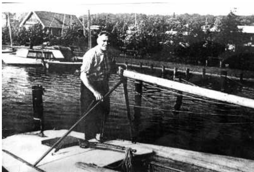
Chr. Bach om bord under omrigging til bermudarigg i 1950

I 1950 ble Rakkertøsen rigget om til bermudarigg og ble dermed betydelig raskere. Med Randers som hjemmehavn ble hun flittig brukt som tur og i regatta. Hun vant mange konkurranser i klassen folkebåt.