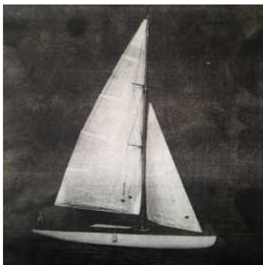
Første gang med ny rigg i 1950